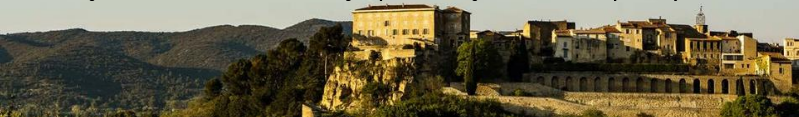
Lauris, village perché du Sud Luberon

Un maximum de balades avec un minimum d'efforts au cœur de cette magnifique région de la Provence, entre villages perchés, vignes et marchés provençaux.