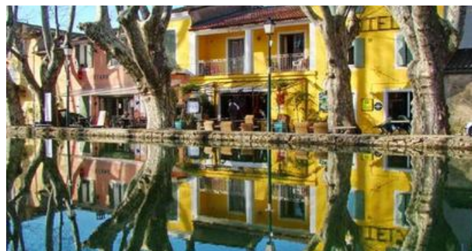
L'étang de Cucuron