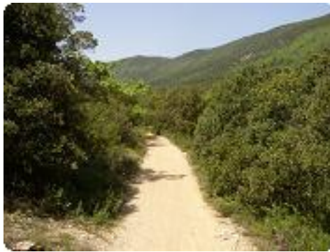
[14] La montagne du lubéron sur la droite.