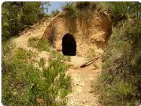
[10] Ancienne habitation troglodyte ?