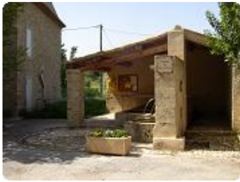
[1] FontJoyeuse, un petit hameau très charmant.