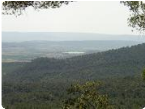
[16] On aperçoit le lac de la Bonde.