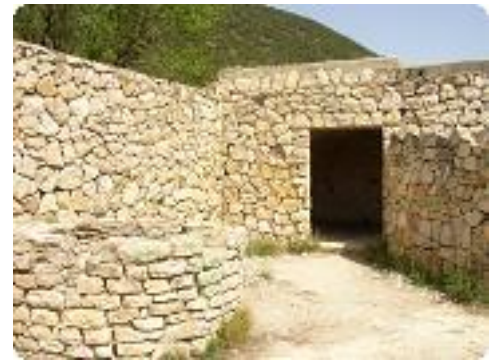
[18] A l'intérieur de l'ancienne Bastide.