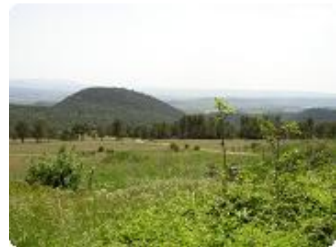
[21] Le chemin du retour.