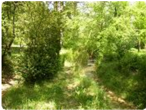
[4] Le début du parcours longeant la rivière.