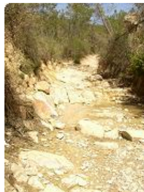
[11] Un lit de pierre pour finir.