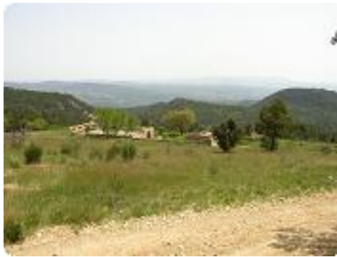
[17] Vue sur les ruines de l'ancienne Bastide.