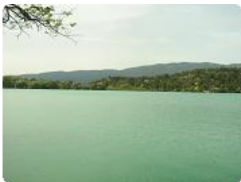
[22] En passant près du lac de la Bonde(au retour).