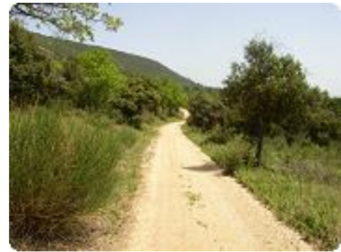
[15] Les dernières montées.