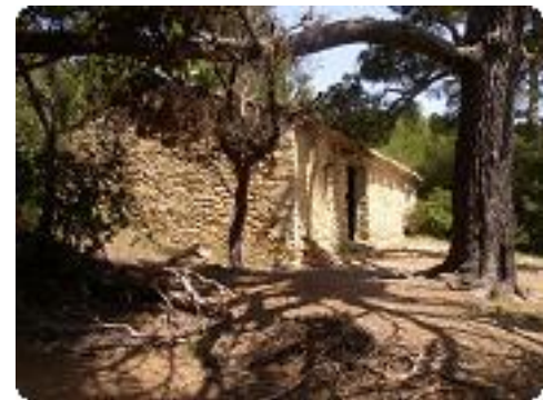
[12] Un ancien cabanon.