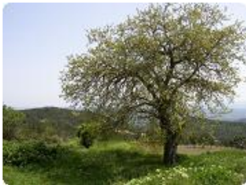
[19] Un endroit sympathique pour déjeuner.