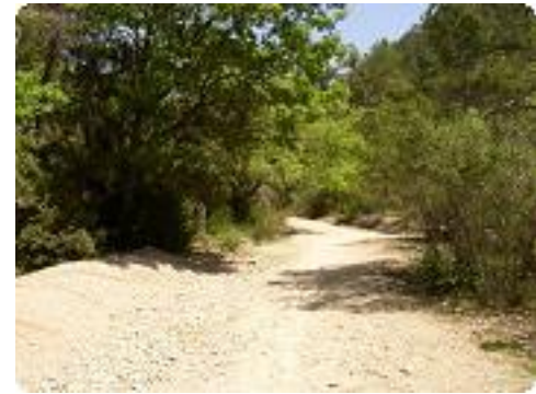
[9] Début de la marche dans le lit de la rivière (presque asséchée).