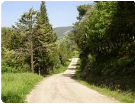
[2] Le chemin vicinal.