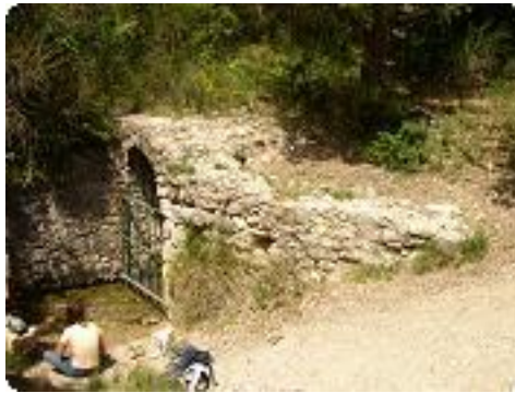
[8] La source de Mirail.