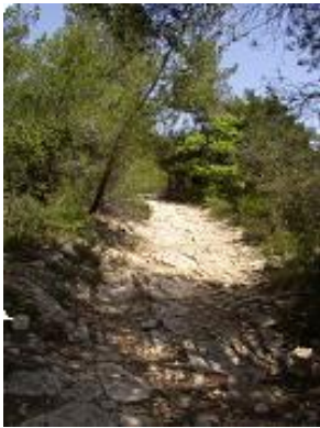
[13] Montée légère par moment, un peu moins par d'autre.