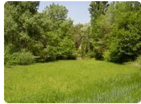
[3] Juste pour la nature.