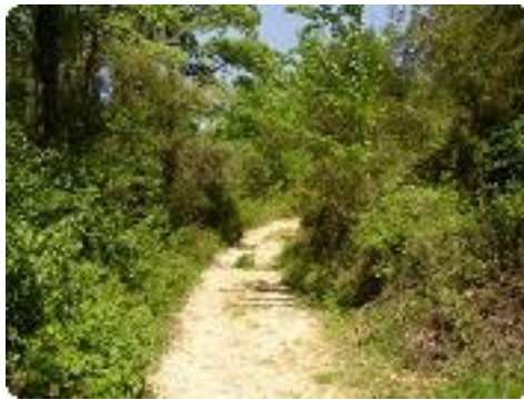
[5] Un large chemin pour commencer.