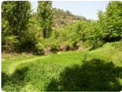
[7] Une petite prairie (prendre au fond).